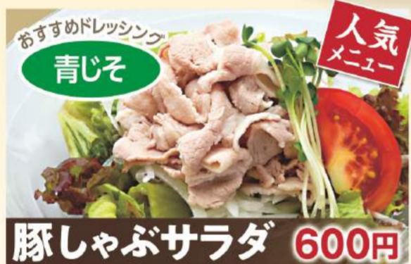
おすすめドレッシング 青じそ 豚しゃぶサラダ 600円