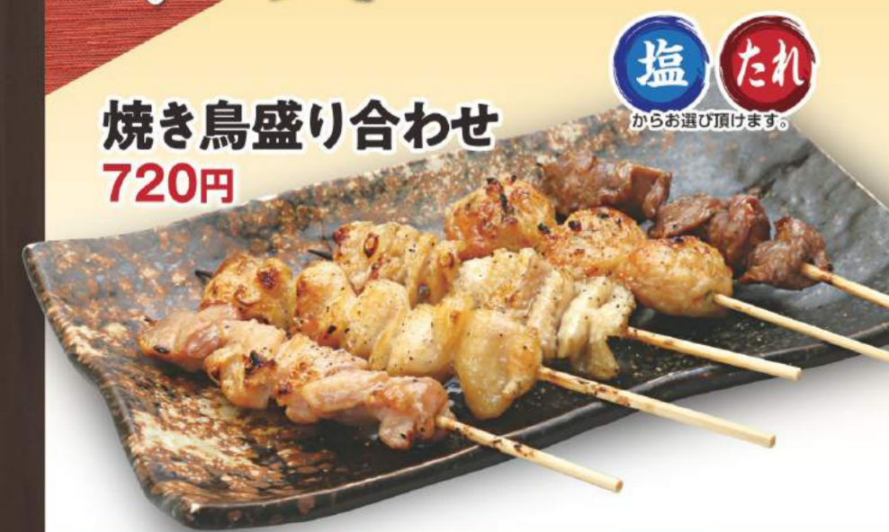
焼き鳥盛り合わせ 720円