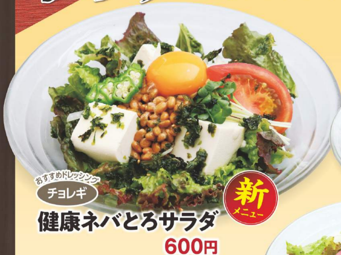
おすすめドレッシング チョレギ 健康ネバとろサラダ 600円