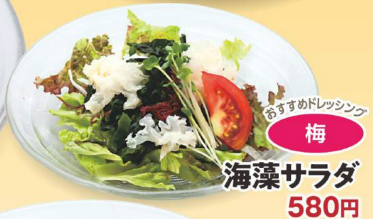
おすすめドレッシング 梅 海藻サラダ 580円