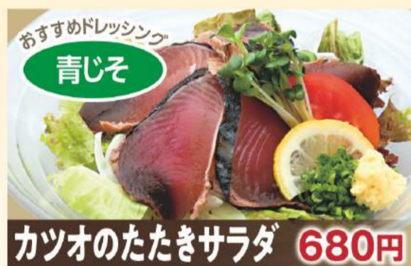
おすすめドレッシング 青じそ カツオのたたきサラダ 680円