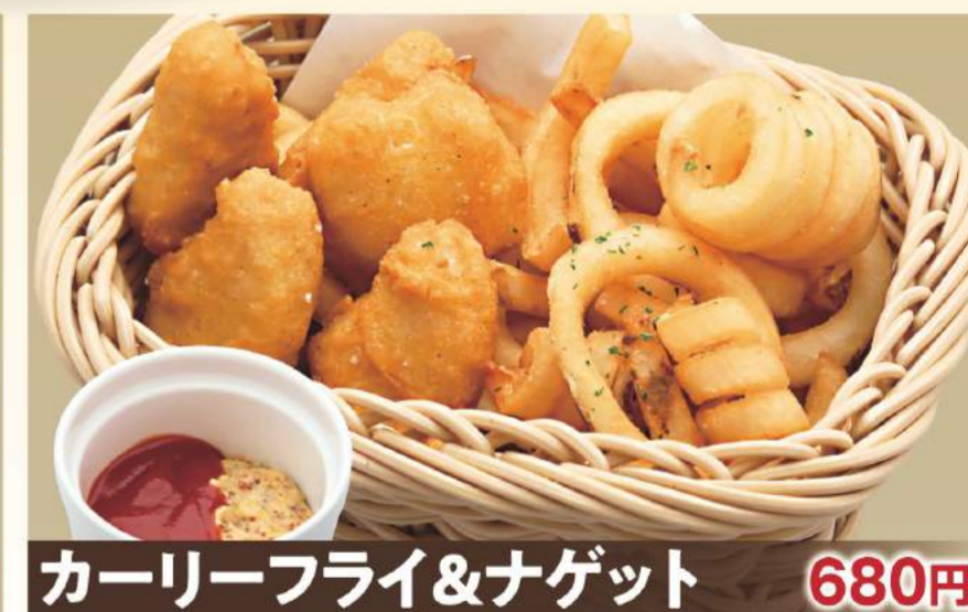
カーリーフライ&ナゲット 680円