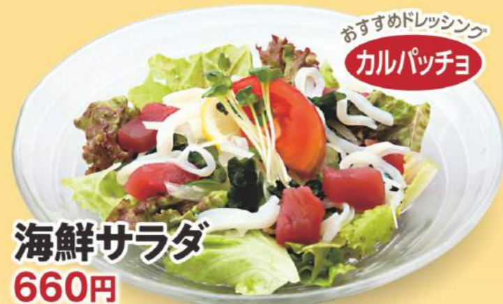
おすすめドレッシング カルパッチョ 海鮮サラダ 660円