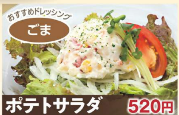
おすすめドレッシング ごま ポテトサラダ 520円