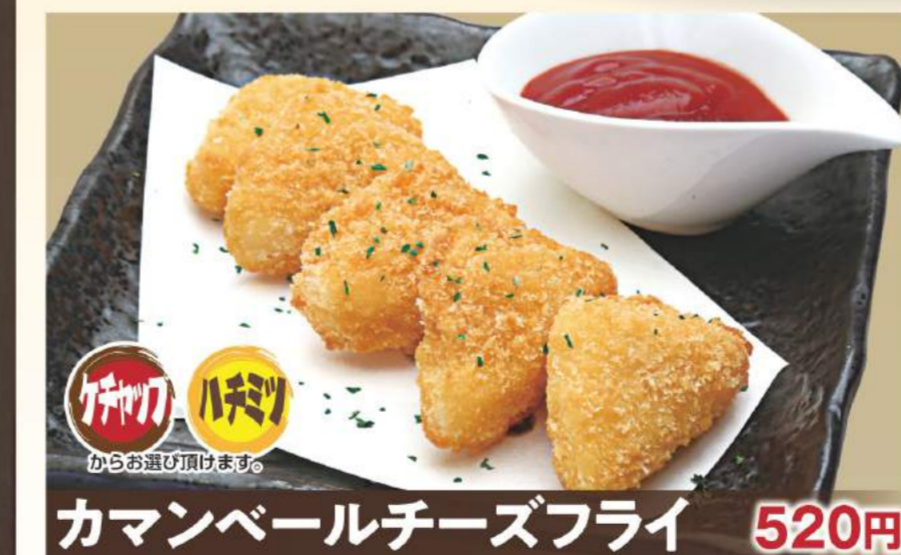
カマンベールチーズフライ 520円