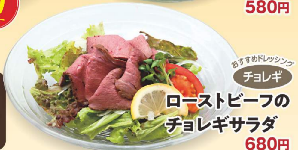
おすすめドレッシング チョレギ ローストビーフの チョレギサラダ 680円