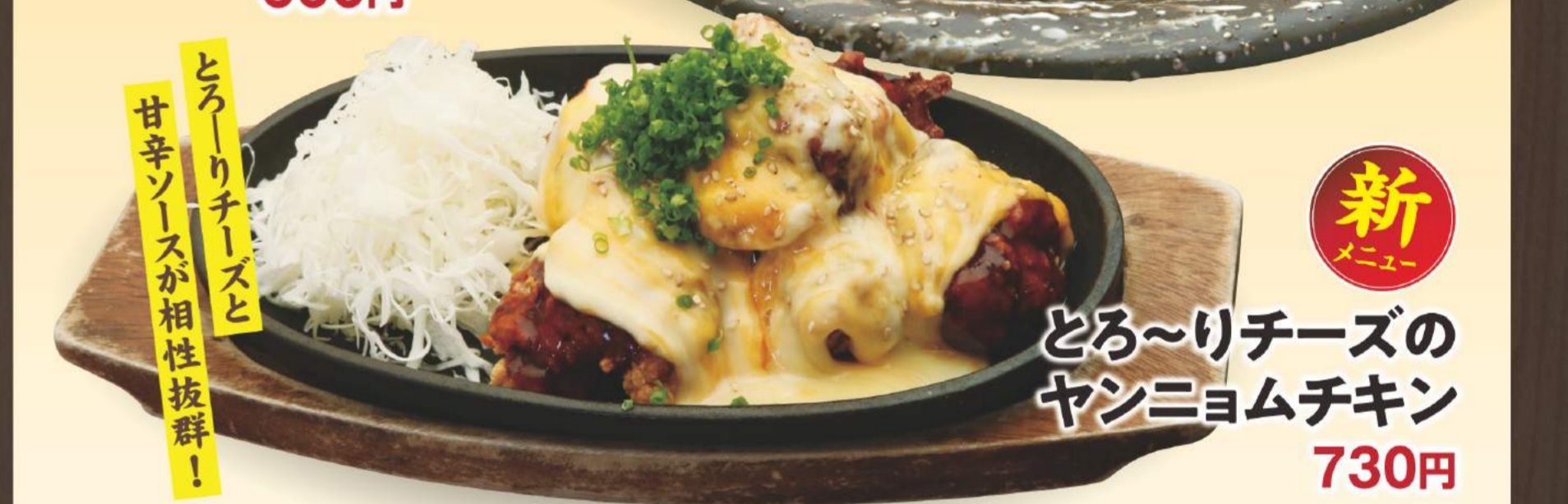
新 とろ〜りチーズの ヤンニョムチキン 730円